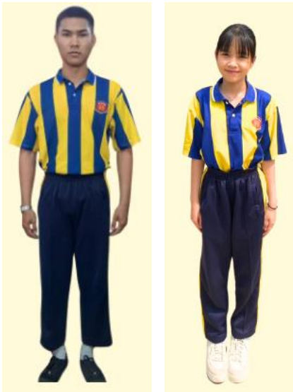
ชุดพลละ ม.ต้น