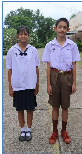
ชุดนักเรียน ม.ต้น