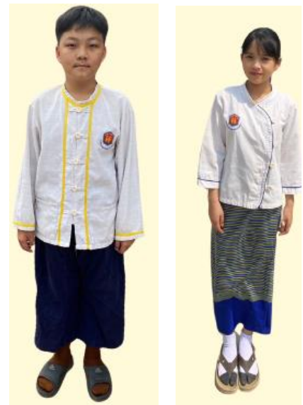
ชุดพื้นเมือง