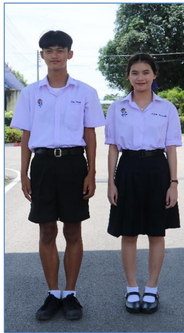
ชุดนักเรียน ม.ปลาย