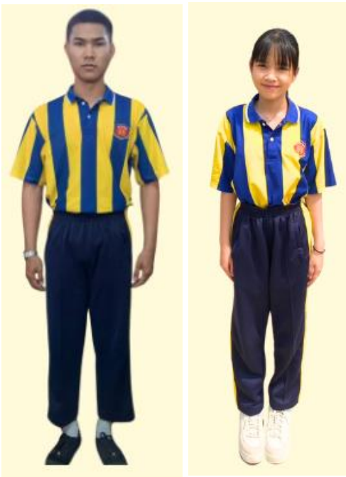
ชุดพลละ ม.ปลาย