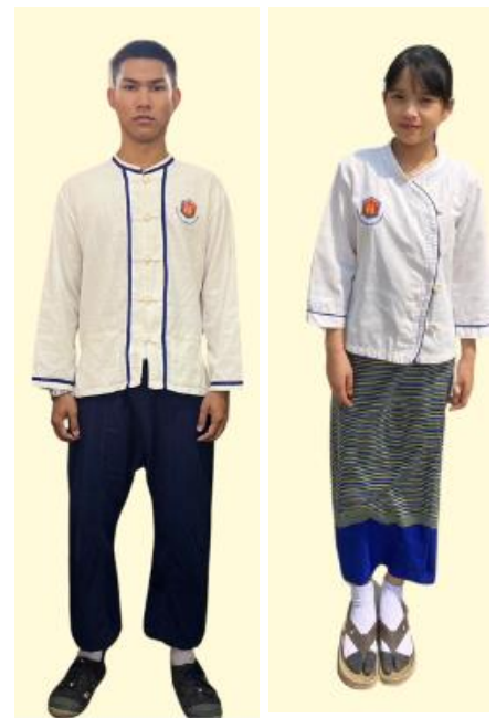
ชุดพื้นเมือง